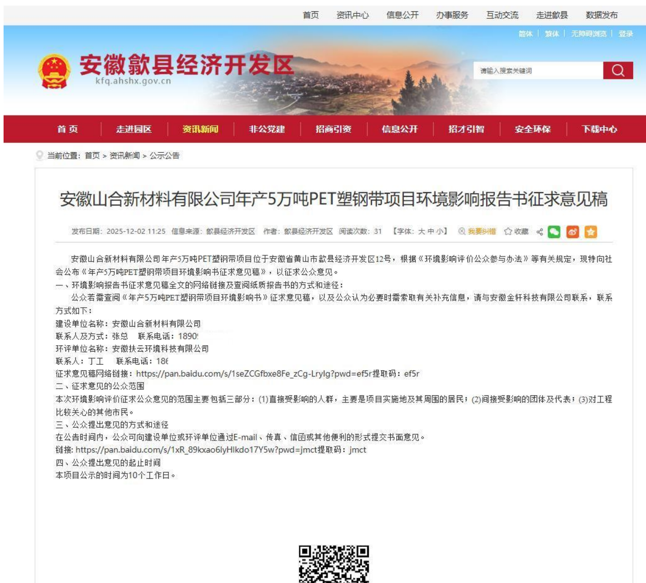
图3 本项目征求意见稿公示网络截图