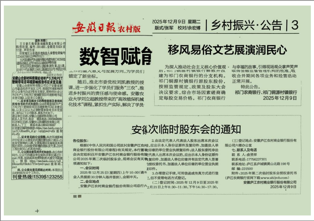
图 4 两次报纸公示图示

2025 年 12 月，建设单位对区域周边的居民进行了走访，对周边居民开展了问卷调查，并在项目位置及附近敏感点处张贴了公告，广泛征求当地群众对于本项目在环境保护方面的意见。现场张贴照片见图 5。