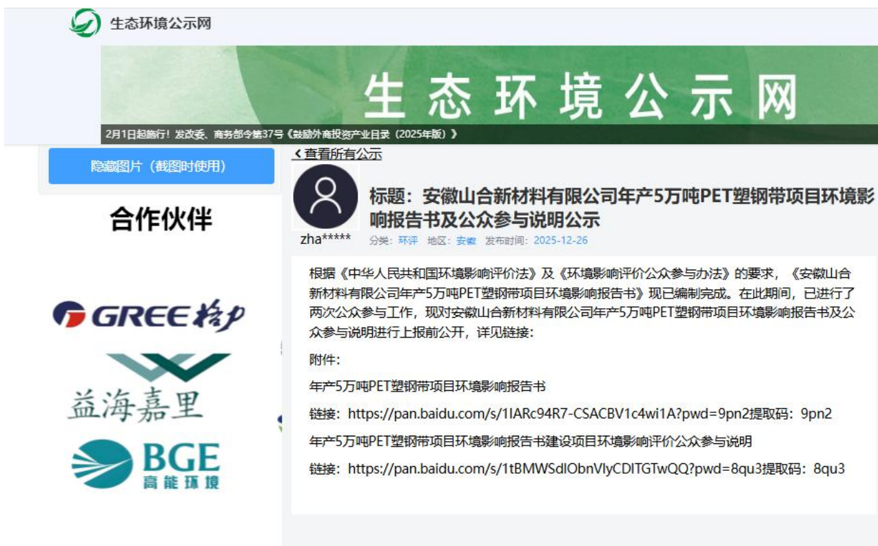
图 6 网络公示截图