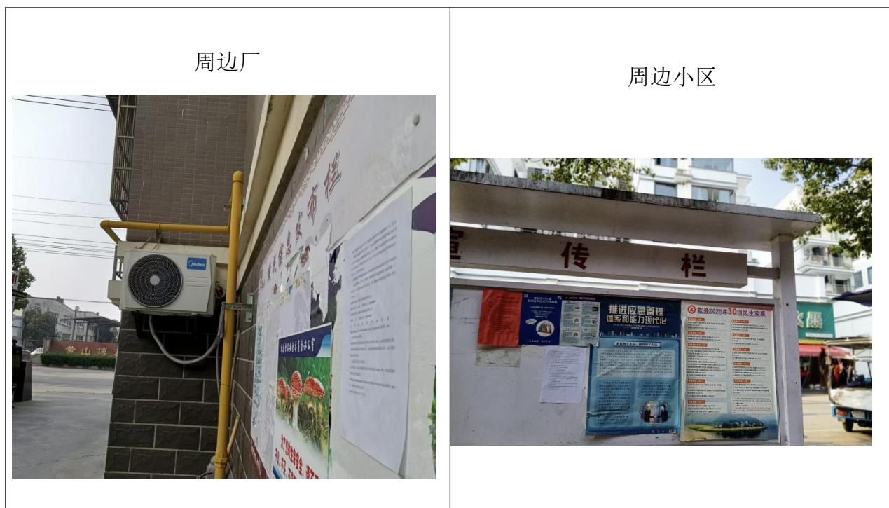
图 5 现场张贴图示